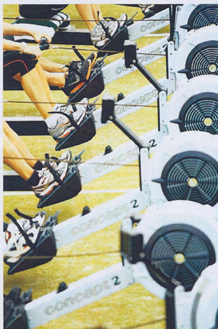
Concept2 Indoor Rowing Trainer Certificate. No. GERIRT01111105AG

erfolgreich an der eintägigen Concept2 Ausbildung teilgenommen hat.